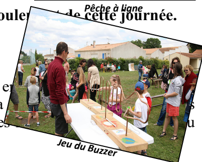
Jeu du Buzzer

L'an passé, les bénéfices réalisés à l'occasion des actions et activités, mises en œuvre pendant l'année scolaire, ont permis à l'association de verser des subventions pour la restauration par les 3 écoles : pour l'école de Bouhet, financement de 2 sorties pour toutes les classes au château des aventuriers en Vendée.