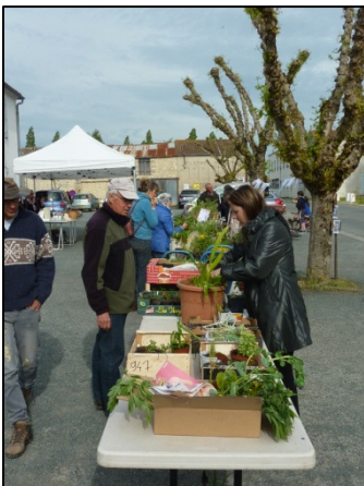
Place du village