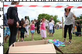
Pêche à ligne de cette journée.

AP3E remercie la municipalité aux élèves de l'école de Bouhet