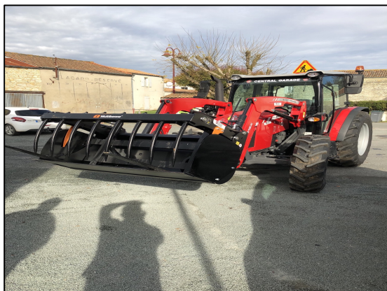
Nouveau tracteur de la commune