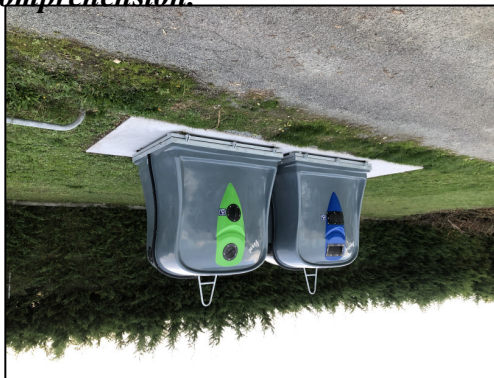
Nouveaux containers installés sur le parking de l'école