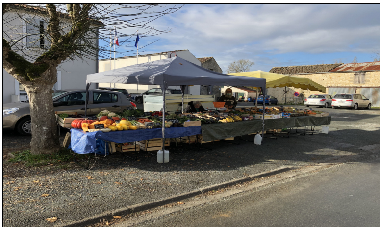
Nouveau : vente de fruits et légumes Michel a le plaisir de vous accueillir tous les mardis de 7 h à 12 h place de la Poste