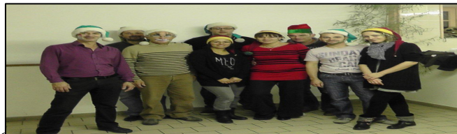
L'Association ABCD, vous souhaite ses meilleurs vœux pour 2015

Les personnes intéressées peuvent se manifester en écrivant un courriel à : abcd.bouhet@free.fr