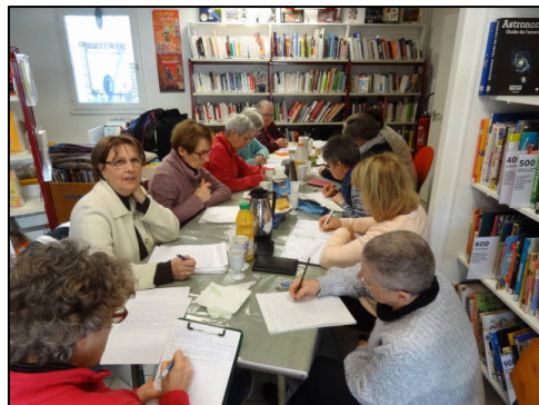
Assemblée générale à Bouhet

L'association "A Livre Ouvert" a tenu son assemblée générale le 22 janvier dernier. Les bénévoles ont fait le bilan de l'année 2017.